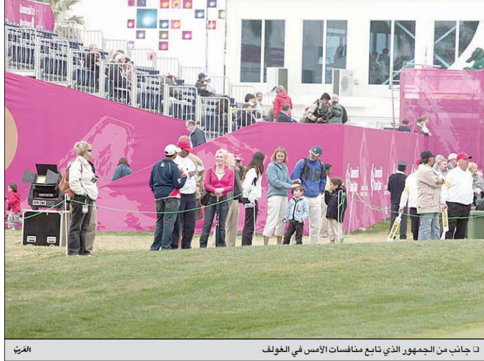
□ جانب من الجمهور الذي تابع منافسات الأمس في الغولف

الدوحة - أمين البركاشي واصل اللاعب السويدي يوهان إدفورز تصدره نتائج اليوم الثالث من بطولة البنك التجاري قطر ماسترز للغولف بعدما وصل مجموع ضرباته 69 أي بـ 3 ضربات تحت المعدل ليتصدر الترتيب العام بمجموع 12 ضربة تحت المعدل منذ بداية المنافسات، وحقق أندرو كولتارد الفائز بلقب سنة 1998 أفضل نتيجة يوم أمس رفقة آدم سكوت بإنهاءه اليوم الثالث بمجموع 65 ضربة أي بسبع ضربات تحت المعدل مما خول له الارتقاء إلى المركز الثاني بمجموع 65 ضربة أي 11 ضربة تحت المعدل منذ بداية المنافسات. وحل في المركز الرابع كل من هنريك ستينسون وأدم سكوت بمجموع 10 ضربات تحت المعدل وكان التقدم يوم أمس للؤلؤ الذي أنهى اليوم الثالث بمجموع 67 ضربة أي بـ 5 ضربات تحت المعدل فيما حقق سكوت 69 ضربة أي بـ 3 ضربات تحت المعدل.